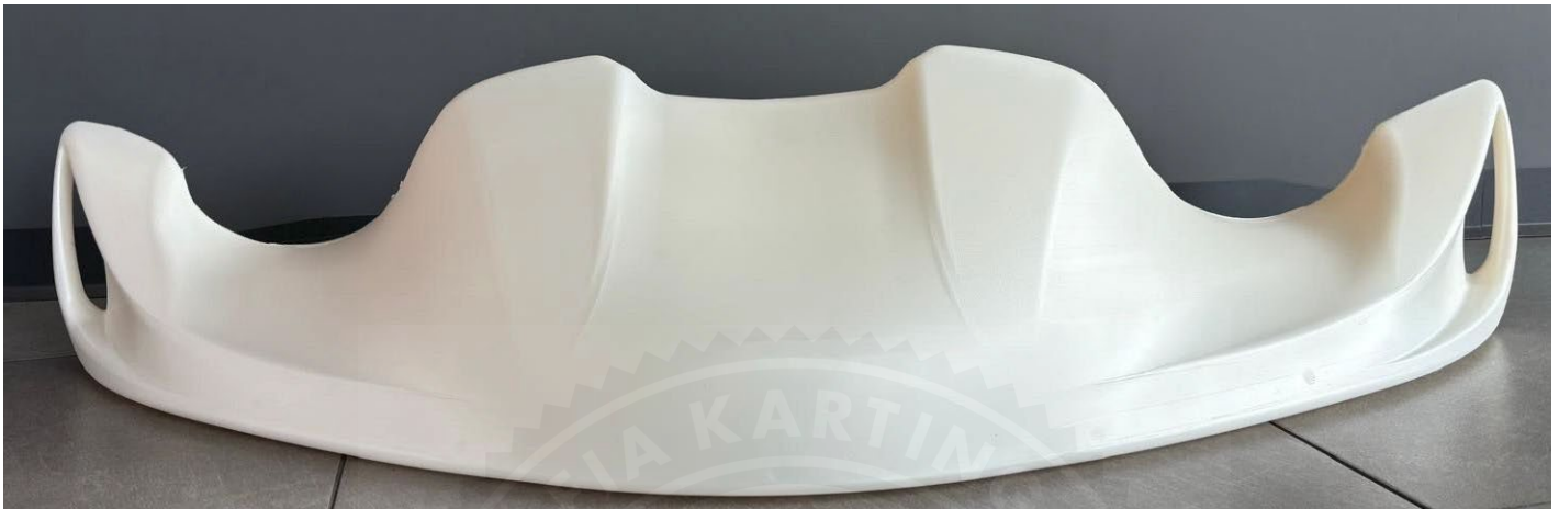
Photo vue de devant du carénage avant / Photo of the front of the front fairing

Signature et tampon de l'ASN / Signature and stamp of the ASN