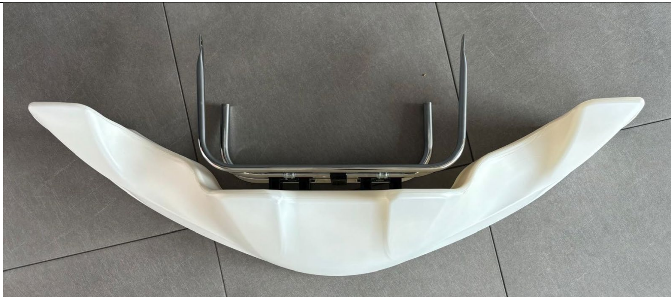
Photo vue de côté avec supports / Photo from the side with supports