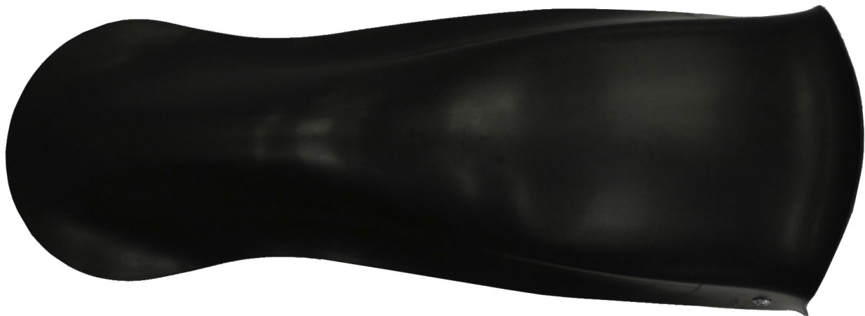
Photos vue de devant du panneau / Photo of the front of panel

Signature et tampon de l'ASN / Signature and stamp of the ASN