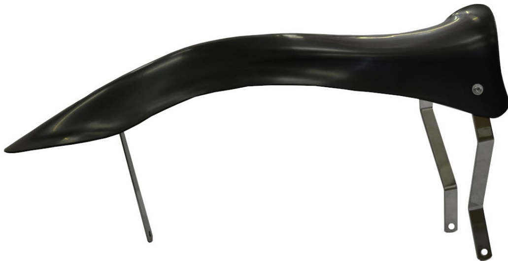
Photo vue arriere avec supports / Photo from the rear with supports